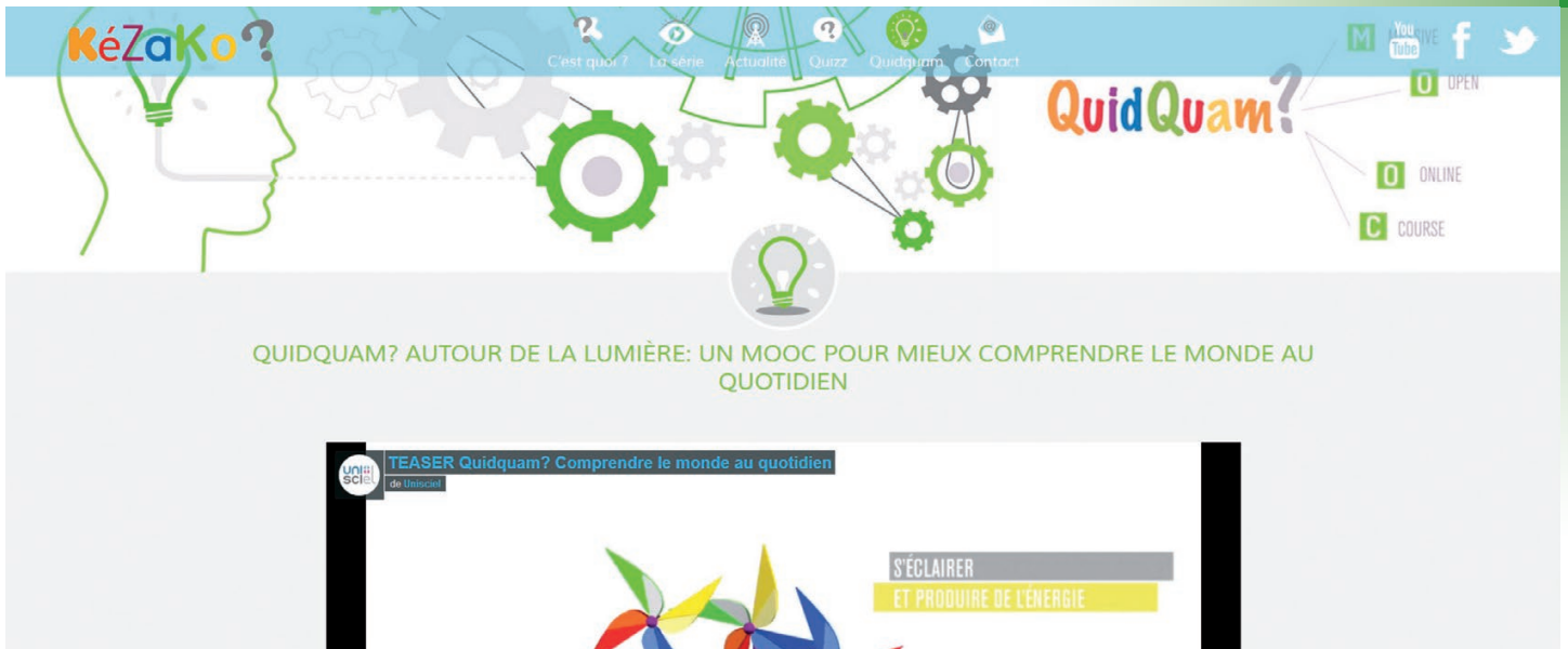
Page d'accueil du MOOC « Quidquam, comprendre le monde au quotidien... autour de la lumière » (2016)

Georges Siemens et Stephen Downes, les pères de la théorie du connectivisme [1]. C'est quatre ans plus tard, en 2012, que le phénomène émerge, avec des millions d'étudiants inscrits à une centaine de MOOC [2], dispensés par trois plateformes (Udacity, Coursera et edX, voir fig. 1). De 2012 à 2016, 6850 MOOC ont été proposés ; ils ont été suivis par 58 millions d'étudiants, dont 23 millions de nouveaux inscrits en 2016 [3].