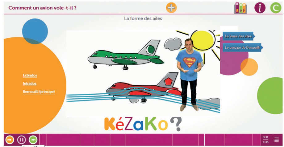
2. Capture d'écran d'un Kézako enrichi. À gauche de la vidéo, accès à un lexique des termes utilisés dans la séquence. À droite, des ressources complémentaires qui approfondissent les notions abordées dans la séquence.

Il est difficile de parler du MOOC Quidquam sans le replacer dans le contexte de la série Kézako. Kézako est une aventure qui a démarré en 2010, en partant du constat que dans les formes traditionnelles de popularisation des sciences (fêtes de la science, festivals, chercheur à l'école...), on dépense beaucoup d'énergie (et d'argent) pour toucher relativement peu de monde, et encore moins en dehors des grandes villes. Nous nous sommes donc fixés comme objectif de proposer une ressource sur Internet, en évitant les défauts habituels, tels que des productions de qualité très variable, une origine pas toujours très claire (et du coup une fiabilité difficile à évaluer), et un public cible trop restreint (si bien que l'internaute peut être frustré de ne rien apprendre de nouveau, ou au contraire de ne rien comprendre, faute d'avoir les prérequis nécessaires).